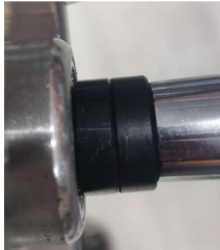
( 4 Pav.)