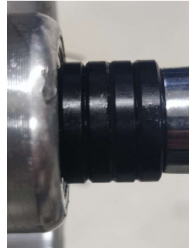
( 5 Pav.)